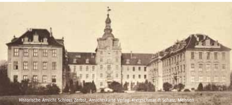
Historische Ansicht Schloss Zerbst, Ansichtskarte Verlag: Kretzschmar & Schatz, Meissen