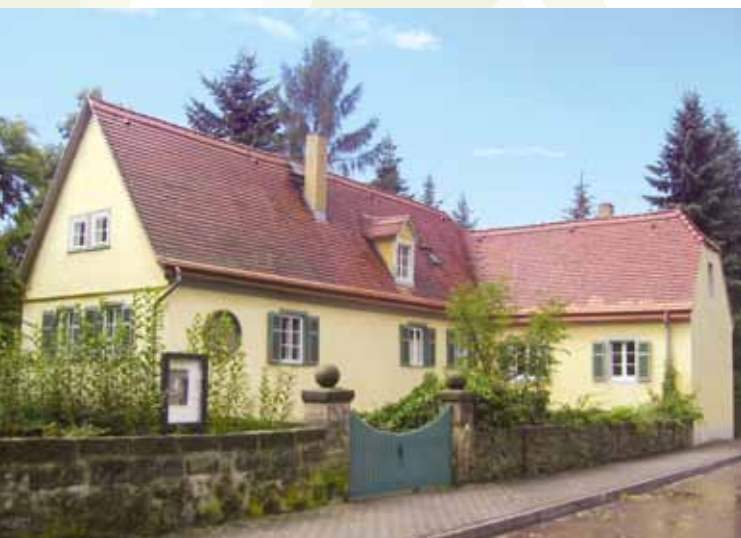
Carl-Maria-von-Weber-Museum, Foto: Wikipedia, Z thomas